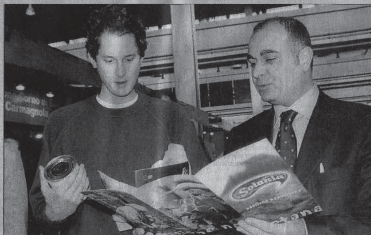
Un attento John Jakob Elkann (a sinistra) al Salone del gusto di Torino nell'apprendere storia e successi del San Marzano. Sotto, foto d'epoca di un'antica fabbrica conserviera di Nocera. Siamo agli inizi degli anni Cinquanta